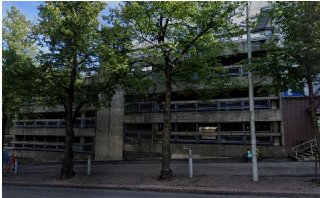
Kuva: Google Maps 2021